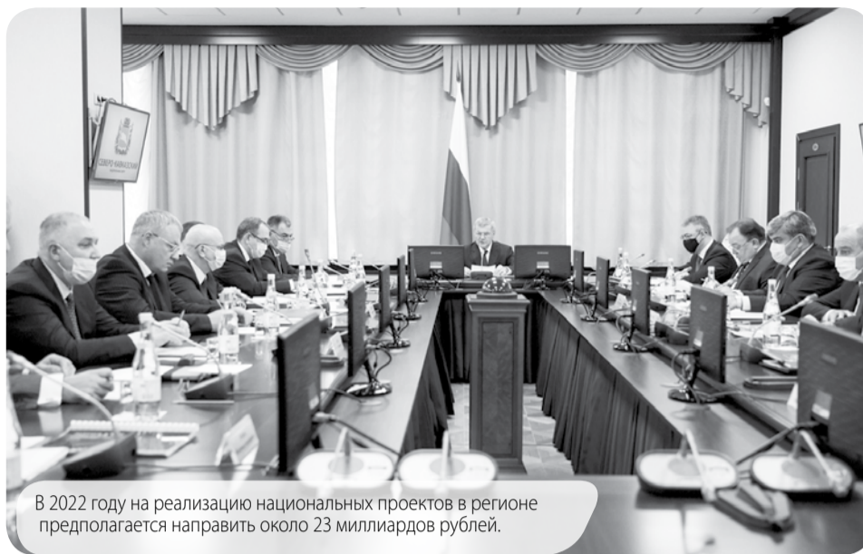
В 2022 году на реализацию национальных проектов в регионе предполагается направить около 23 миллиардов рублей.

– Ключевым направлением проекта в нашем крае является строительство и реконструкция восьми общеобразовательных организаций. Ввод в строй этих объектов позволит создать 6608 новых учебных мест, – отметил глава края.