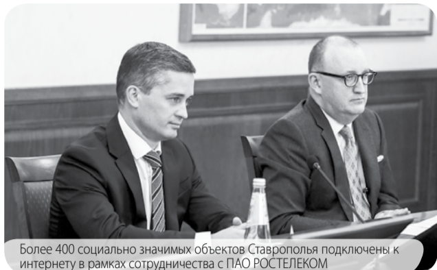
Более 400 социально значимых объектов Ставрополья подключены к интернету в рамках сотрудничества с ПАО РОСТЕЛЕКОМ

Это является одним из результатов партнёрства правительства края с компанией ПАО «Ростелеком» в рамках цифровизации Ставрополья.